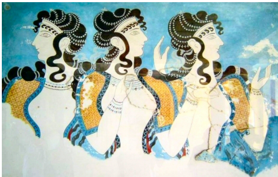
Fresque du palais de Cnossos.

Les grecs, comme d'autres cultures européennes, considéraient la peinture comme la plus noble forme d'art. ainsi, on comprend aisément à partir de l'ensemble de cette activité et surtout de sa production picturale, qu'il s'agit bien de la peinture sur poterie, demeurant la partie la mieux conservée de cette pratique artistique, mais aussi des peintures sur sarcophages, sur panneaux ou des fresques.