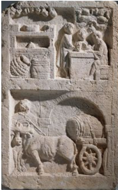
Relief d'une scène de taverne et transport de barils 5

Quant à l'art romain, on peut dire qu'il a été influencé par la Grèce et, d'une certaine manière, on peut considérer qu'il est le descendant de la peinture grecque antique. Cependant, la peinture romaine possède des caractéristiques uniques. Les seules peintures romaines qui ont survécu au temps sont des peintures murales, la plupart dans des villas de Campania qui se situe dans le sud de l'Italie.