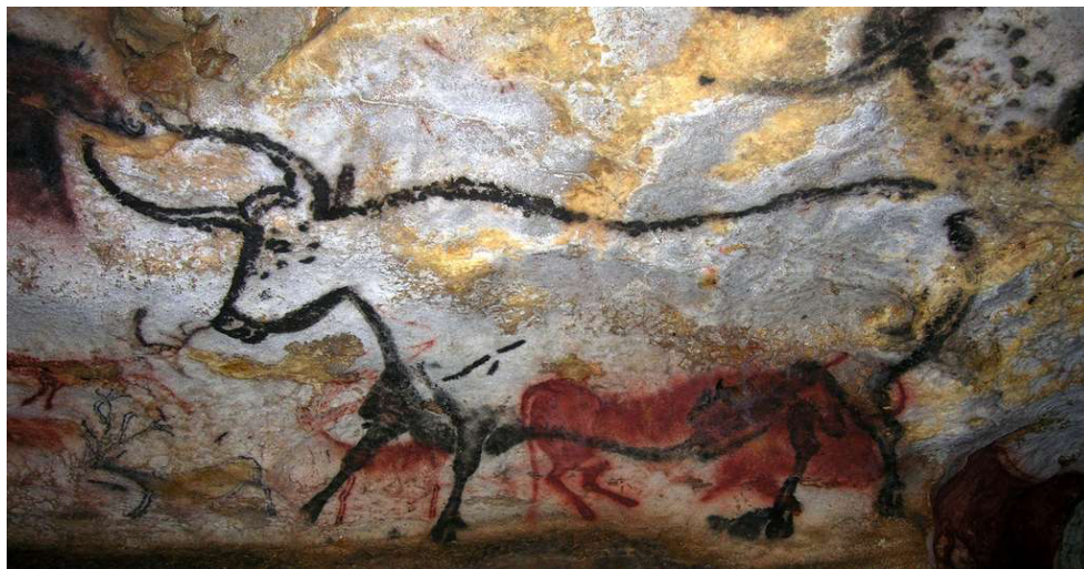
Peinture de la grotte de Lascaux 2

Certains historiens de l'image font remonter son existence de 40000 à 10000 ans av. J-C, et c'est ainsi que Laurent Gervereau retrace que depuis cette époque, « des manifestations plastiques préhistoriques se retrouvent de par le monde » (Gervereau, 2004. p. 15). L'histoire de l'image commence dans la période Paléolithique 1 . Elle est née, à la lueur d'une torche, au fond d'une caverne. L'image fut au centre de ses réflexions dans laquelle l'homme a laissé les traces de ses facultés imaginatives sous forme de dessins sur les rochers destinés à communiquer des messages. Gelb Ignace Jay montre que c'est « Partout à travers le monde, l'homme a laissé les traces de ses facultés imaginatives sous forme de dessins, sur les roches, qui vont des temps les plus anciens des paléolithiques à l'époque moderne » (Jay, 1973. p. 44) ; prenons celle des peintures rupestres (grottes de Lascaux) comme exemple concret dans cette période.