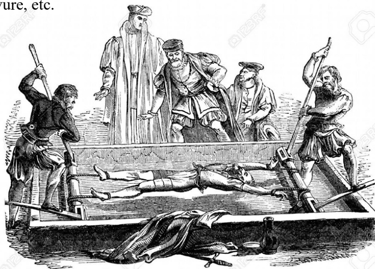
Image gravée d'une victime torturée sur un milieu médiévale âges en rack en Angleterre, Royaume-Uni 6

Au Moyen-Âge, l'avènement du christianisme s'est accompagné d'un changement d'état d'esprit qui a influencé les styles de peinture. A noter que l'image prenait plusieurs formes telles que : peinture, fresque, dessins, gravure, etc.