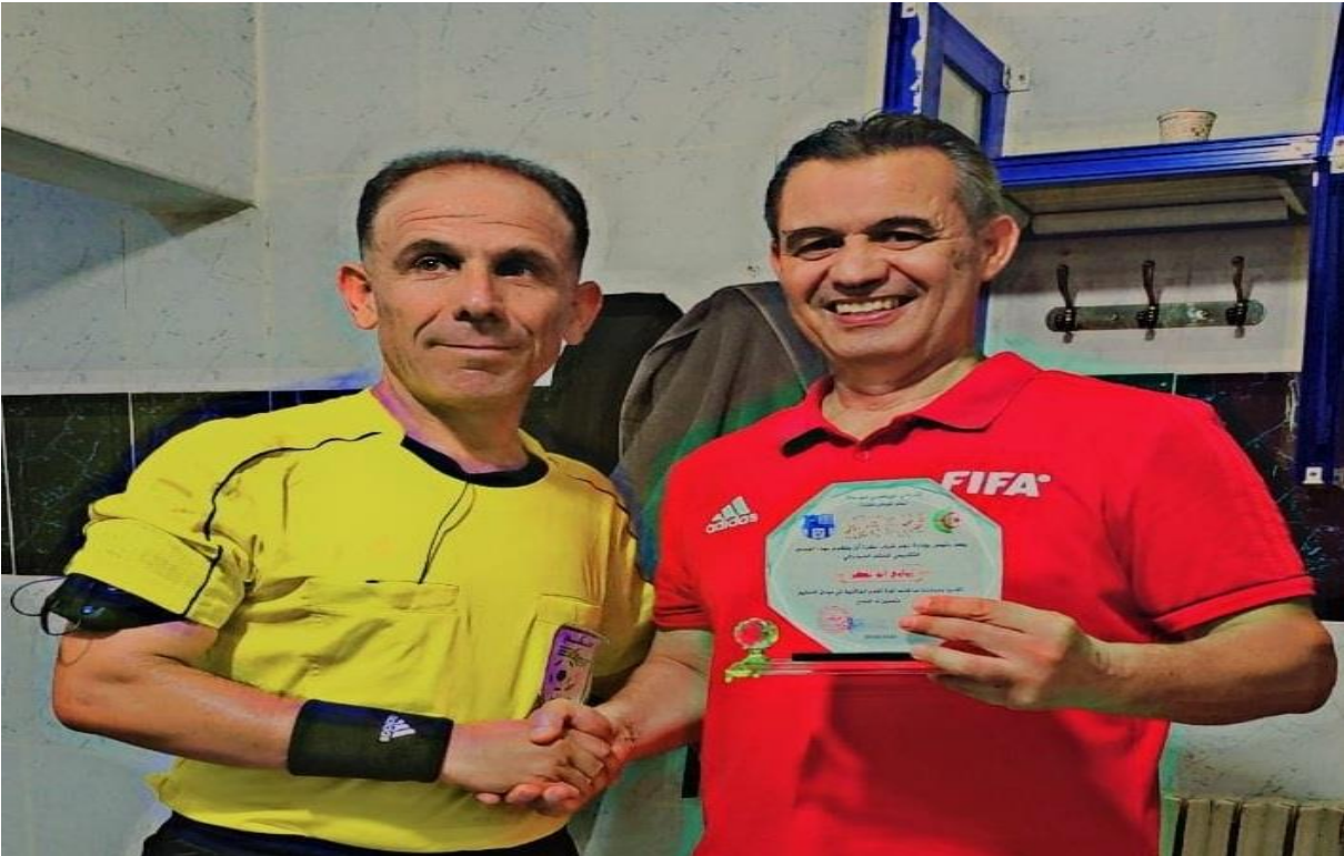
الحكم بن عيسى محمد مع الحكم الفيدرالي بوبكر زاوي