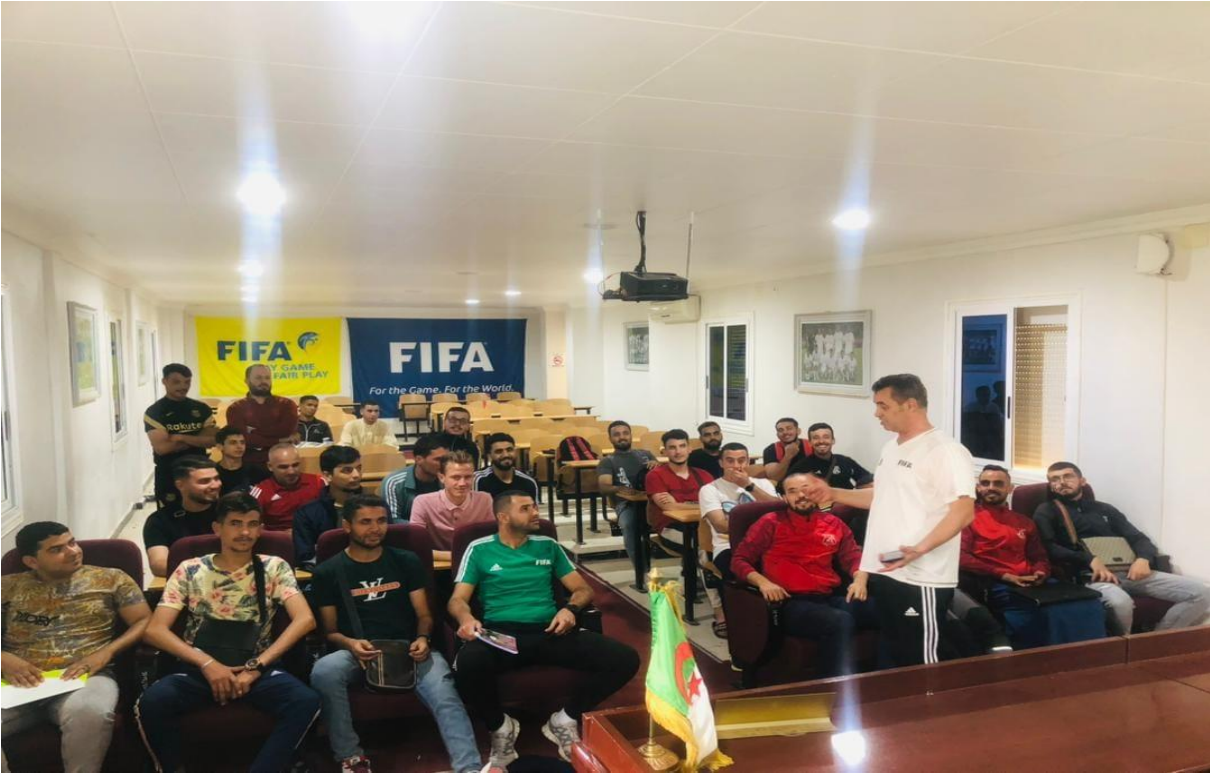
الحكم بن عيسى في تكوين نظري للحكام القوانين الجديدة في التحكيم