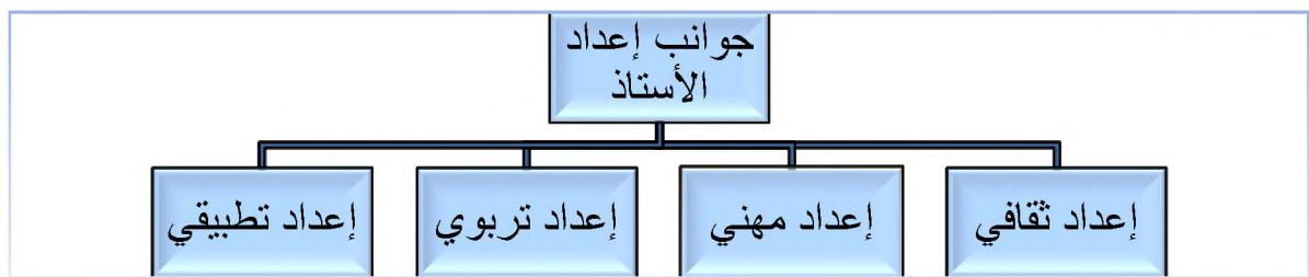
الشكل رقم(01) :يمثل جوانب إعداد الأستاذ

إن الاهتمام بعملية إعداد الأستاذ للقيام بواجباته و مسؤولياته من الأمور التربوية الأساسية، لا بد أن يكون بتأهيله علميا و مهنيا للقيام بهذا الدور. و لكي تقوم بإعداد الطالب ليكون قادرا على مسايرة العصر الحالي و المستقبلي يجب أن تتضافر الجهود من أجل إعداده من خلال الجوانب التالية: